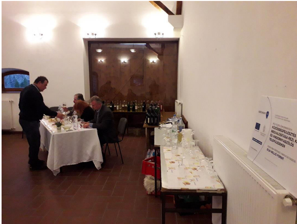
Borok kitöltőse a bírálóbizottságnak