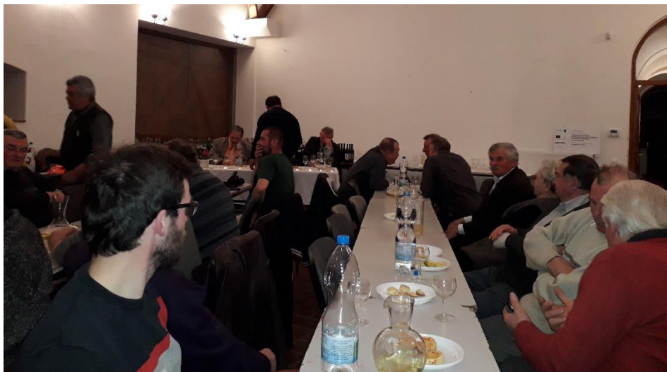
Vacsora és borok megvitatása