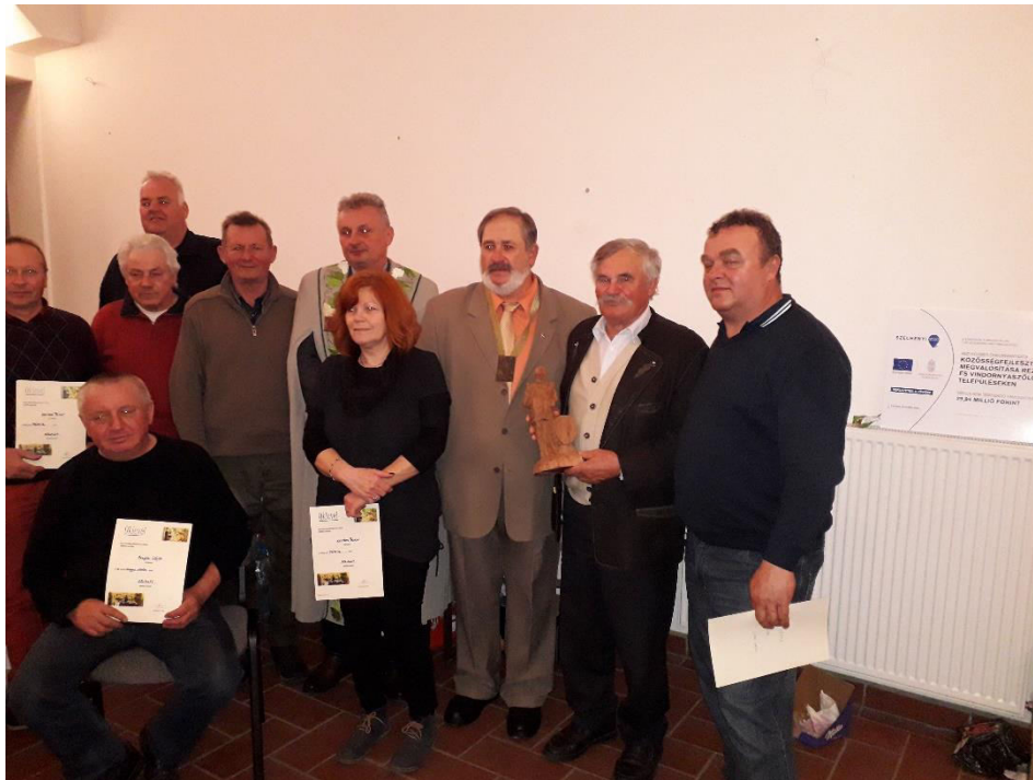
Érmes és okleveles borászok