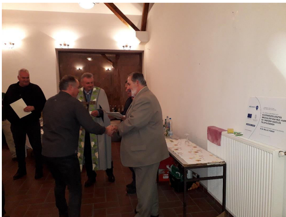
Oklevelek és érmek kiosztása