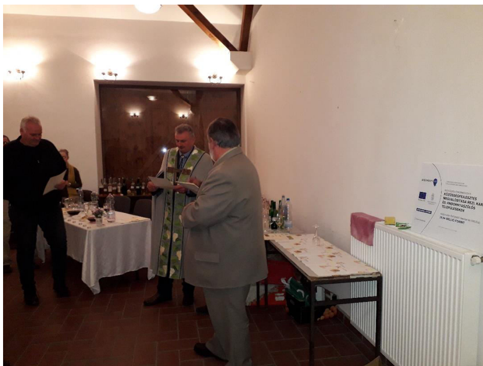
Bírálóbizottság véleménye a borokról